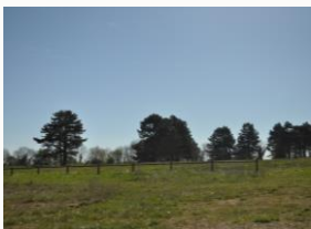
Le terrain hippique

1. Départ : Il est situé à 1km de Sion sur la route départementale D53, corniche Gaston Canel, de Sion à Vaudémont. Si vous souhaitez vous stationner, nous vous conseillons de garer votre voiture à côté du local technique proche du terrain hippique. Lors de la randonnée vous foulerez des calcaires d'anciens fonds marins, n'hésitez pas à télécharger l'annexe géologie sur le site des Randonneurs du Saintois. Sur place, le local aux étoiles (toilettes), propriété communale, est ouvert toute la période estivale.