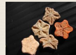
Etoiles de Sion