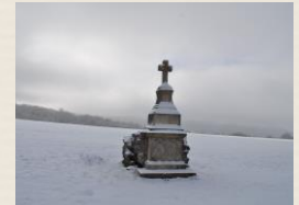
Croix Ste Marguerite

2. Terrain hippique : Il était auparavant le théâtre de deux manifestations : l'une au printemps et l'autre, durant la semaine du 14 juillet. Ces dernières ont été suspendues depuis 2014. C'est également ici que les gens du voyage se retrouvent nombreux pour leur pèlerinage annuel du mois de mai.