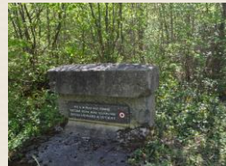
Stèle de Juvigny